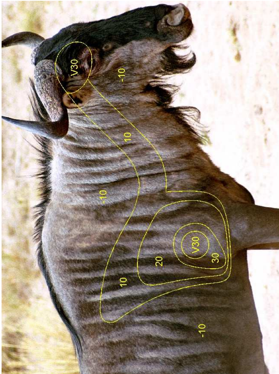
Teiken werklieke grootte: WxH = 1000 x 750mm