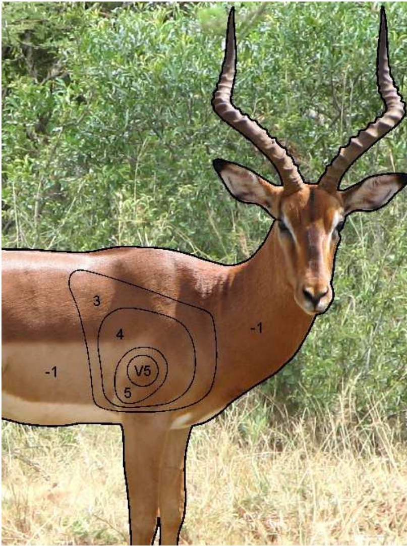
Teiken werklike grootte: W x H = 750 x 1000m